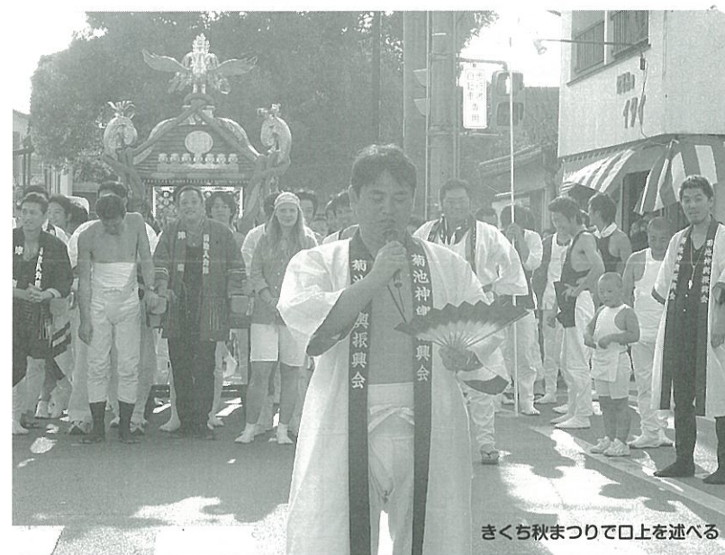
きくち秋まつりで口上を述べる

これまでの役職 県議会第79代副議長 熊本県監査委員 議会運営委員長 県議会各種常任委員長 各種特別委員長