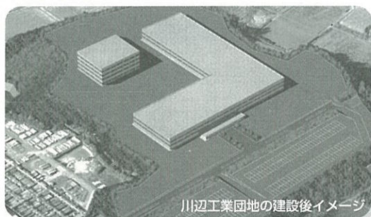
川辺工業団地の建設後イメージ