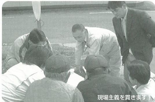
現場主義を貫きます

日本の農林業の大転換期です。農業の新しい制度を現場にあった制度に見直し、担い手育成や集落営農を推進します。中山間地帯に環境保全型農業制度の導入を計ります。林業の新生産システムで林業流通システムの再構築を目指し新しい林業を創造します。