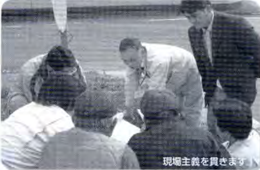
現場主義を貫きます

街の元気が菊池の元気です。国道325号4車線化新規工区の早期着手を目指します。無担保・保証人不要の熊本県CLO融資等で地場産業を応援します。くまもと臨空テクノパークに指定された旭志川辺や、田島・蘇崎・林原の各工業団地への企業立地を推進します。