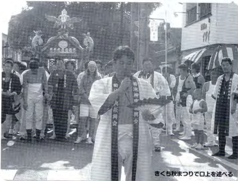
きくち秋まつりで口上を述べる