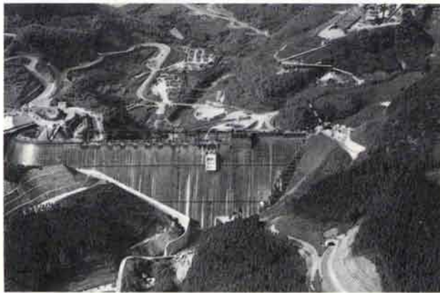
完成間近の竜門ダム