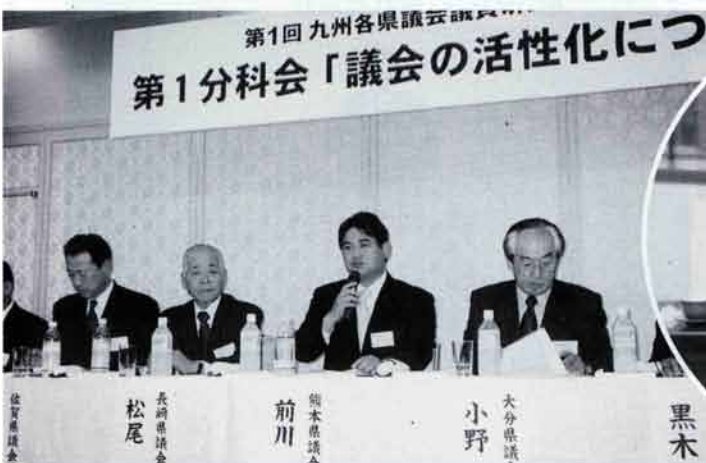
九州各県議会のセミナーにパネラーとして出席

この四月から二つの新しい税金が生まれました。それは「産廃税」と「水と緑の森づくり税」です。「産廃税」は私の政治テーマの一つである産廃問題で、民間まかせの迷惑施設から少しでも地元に戻元できるシステムとして導入することが出来ました。また「水と緑の森づくり税」は、私が自民党のプロジェクトチームの座長としてその導入の推進をしてきたものです。地球温暖化の問題で森林の果たす役割また地下水の恩恵等々を考えれば、県民みんなで森林を守るという発想が必要です。二つの