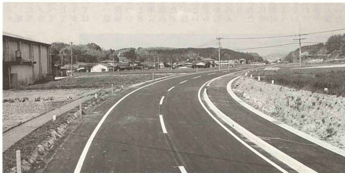
← 今年四月に完成した中原バイパス