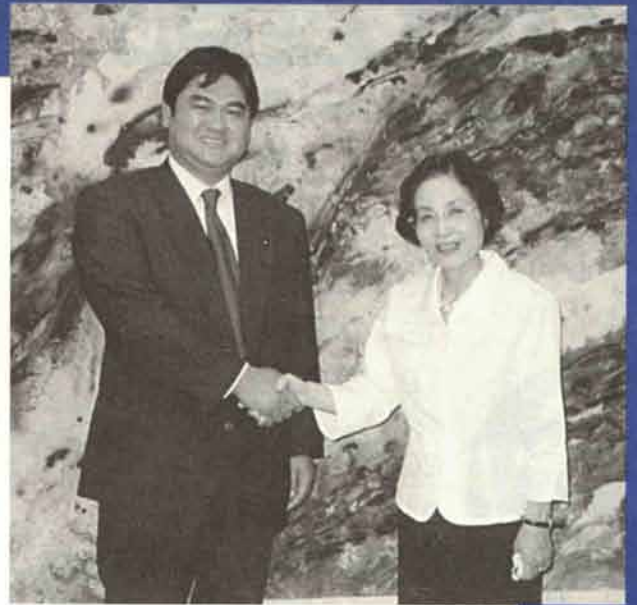
↑潮谷新知事と知事室にて

「環境立県くまもと」づくりを推進するため、環境政策課内に「環境立県推進室」を置く。十年ぶりに新たな環境基本指針を策定する。廃棄物問題の解決のため、県民や事業者の協力をえながら循環型社会づくりを進める。