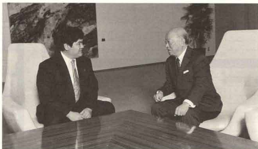
→ 故福島前知事のご冥福を祈ります

学部蒲島郁夫教授が「民主主義の真髄は、競争である。」同時に、成熟した民主主義では選挙で生じた深い分裂と亀裂を早急に「癒す」メカニズムも必要である。」と述べておられます。日本人の気質からして、なかなか簡単ではないと思いますが、一人の政治家として努力を忘れてはならないと考えております。